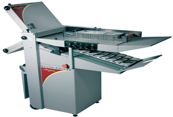
2 ➔ Morgana Major – rješenje za falcanje araka

smještene u užem ili širem centru grada. Posljedica te činjenice je vrlo skup poslovni prostor te je svaki četvorni metar prostora dragocjen, posebice ako se želi imati cjelovita dorada koja iziskuje puno doradnih strojeva. Stoga je kompaktnost, tj. zauzimanje što manje prostora jedna od osnovnih traženih karakteristika za svaki doradni stroj namijenjen digitalnom tisku. Male dimenzije stroja stvaraju uštedu prostora, a time i novca.