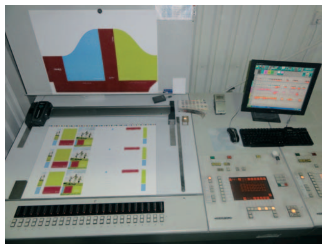
3 Prikaz kod kupca Grafokor

tiska cijele naklade Printflow DC pomaže da održavate vrijednosti nanosa boje u granicama tolerancije.