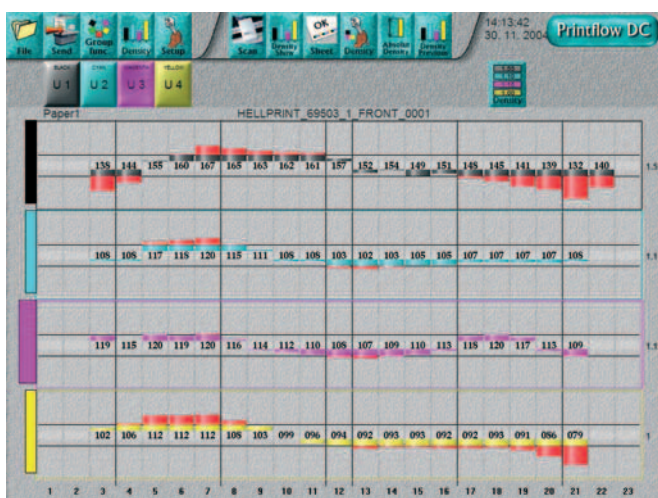
2 Prikaz na monitoru izmjenjenih vrijednosti i odstupanjima koje je potrebno korigirati