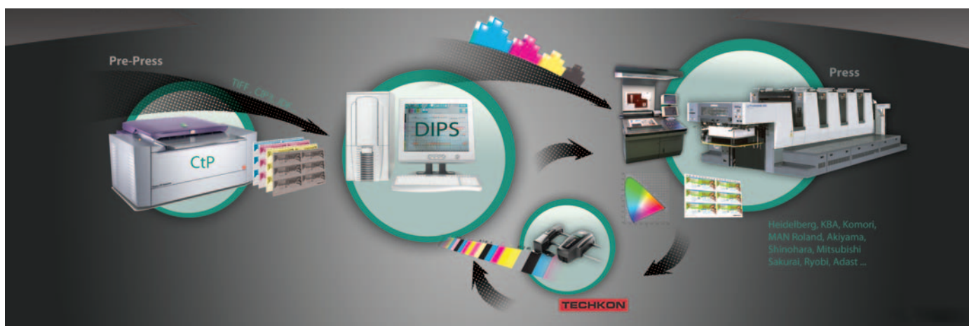
1 Printflow DC Closed-loop sistem s Techkon SpectroDrive automatskim spektrofotometrom